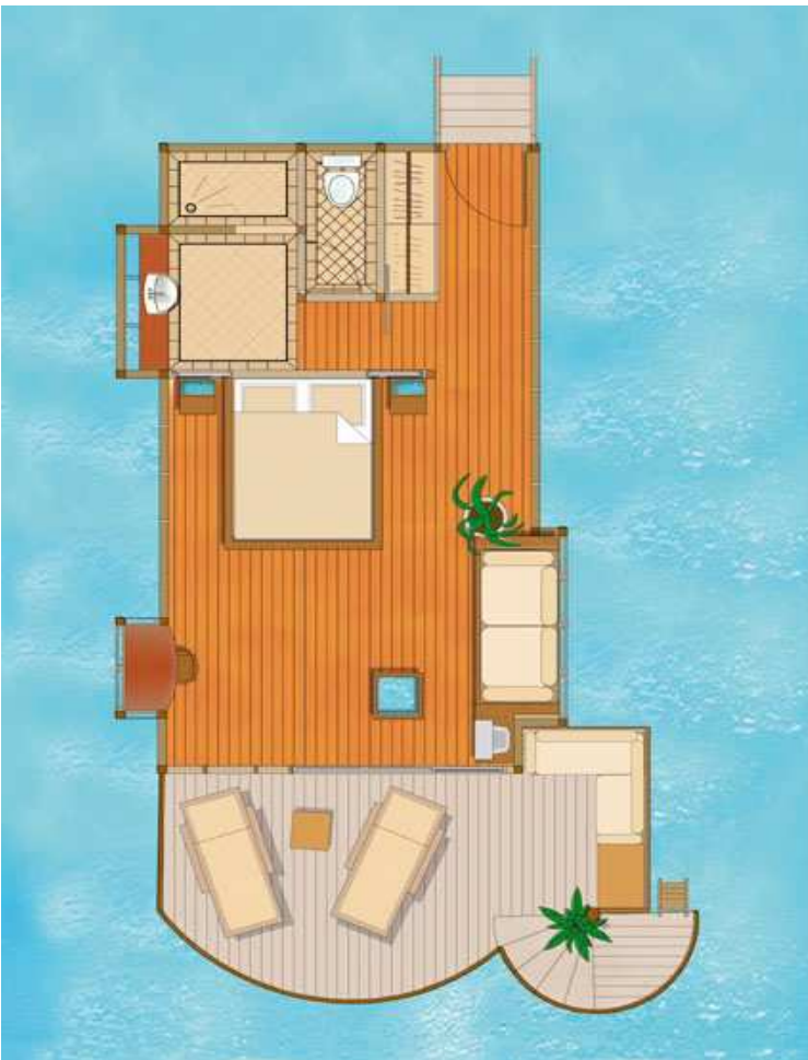
Overwater Bungalow / Bungalow Pilotis