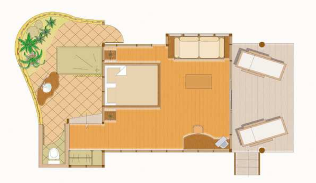
Beach Bungalow / Bungalow Plage